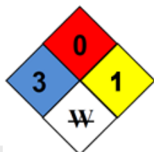
Diagrama de Hommel:

Sistema de classificação utilizado: National Fire Protection Association: NFPA 704